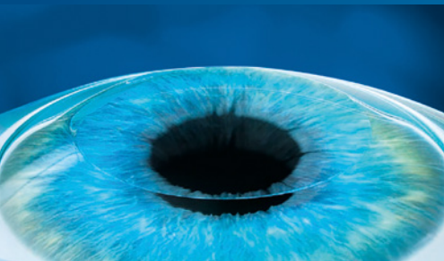
3. Flap wird zurückgeklappt